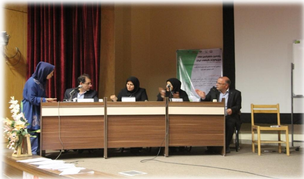
تشکیل هیات رئیسه جلسه به همراه نماینده وزارت علوم