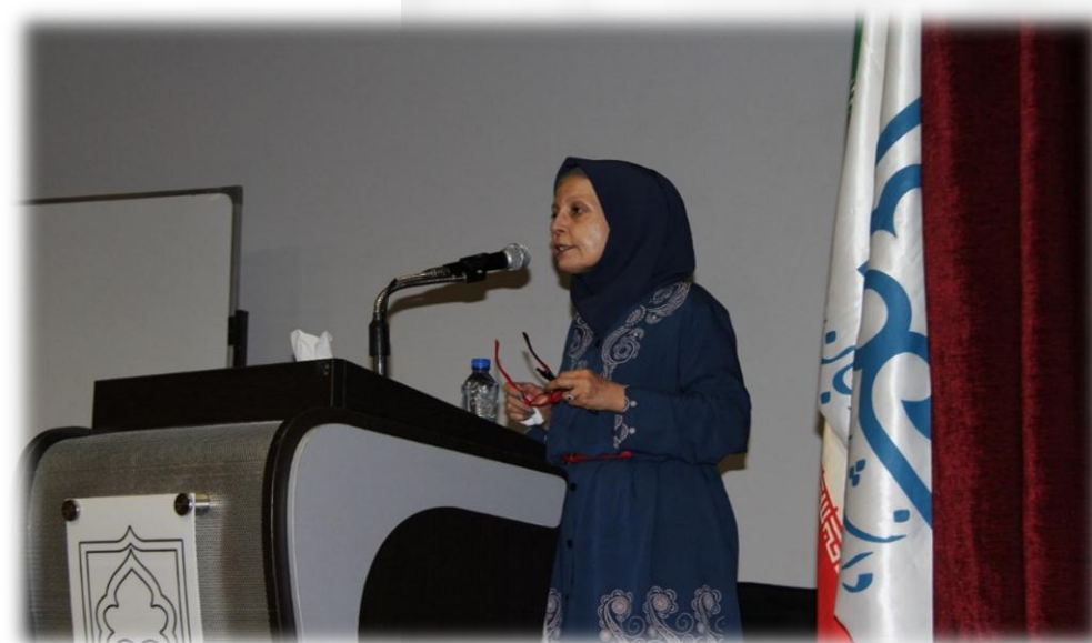
نماینده وزارت علوم